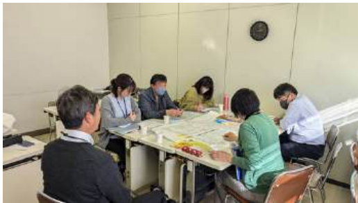
宇野地区連合自治会