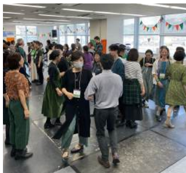
せとうちケーリーのイベント

「こんなことやってみたいな！」を実現するための「まち・ひと・まなび相談室」を開設しております。今年も、目的型の団体や、コミュニティの方からご相談を受けております。