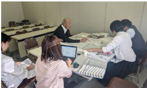
築港東コミュニティ協議会

また、合わせて、コミュニティ協議会がまとめる町内会や自治会のエリアを地図に明記していただいております。大変丁寧にご対応いただいております。