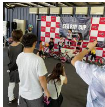
2024年度玉野市協働のまちづくり事業 「たまのランバイク」のイベント

昨年からご相談を受けてきた団体のイベントが成功し、次につながる思いを共有させていただくこともありました。また、玉野市協働のまちづくり事業補助金を受けた団体の伴走支援も行っています。